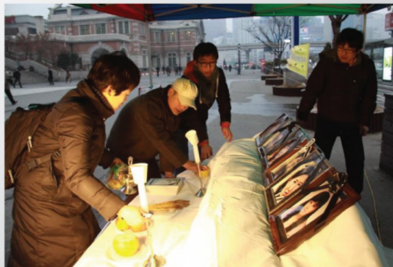
Emlékezés a Samsung áldozataira

Ezért a nyugati államok - köztük Magyarország is - már több mint negyven éve betiltották oldószerként történő alkalmazását, Kínában viszont még napjainkban is használják.