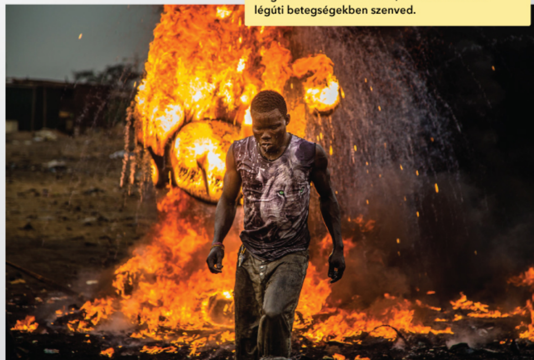
A ghánai Accra város határában is embertelen körülmények között történik az e-hulladékok feldolgozása (a kép az Üdvözöljük Szodomában c. dokumentumfilmből származik)

Az e-hulladék feldolgozásról hírhedtté vált kínai Guiju környékén a gyermekek vérében átlagosan 54 százalékkal magasabb az ólomtartalom, és 80 százalékkal légúti betegségekben szenved.